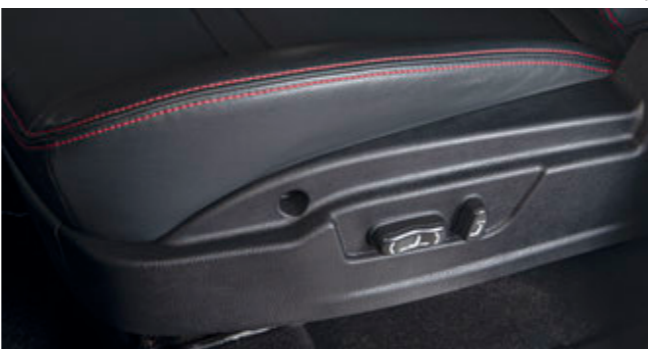
صندلی راننده با تنظیم برقی در ۶ جهت