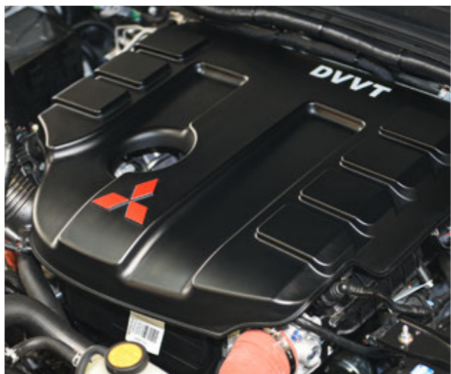
موتور ۲/۴ لیتر توربوشارژر میتسوبیشی