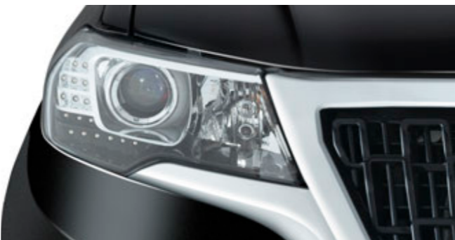
چراغ‌های جلو هالوژن