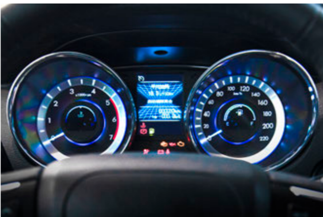
نمایشگر TFT اطلاعات سفر